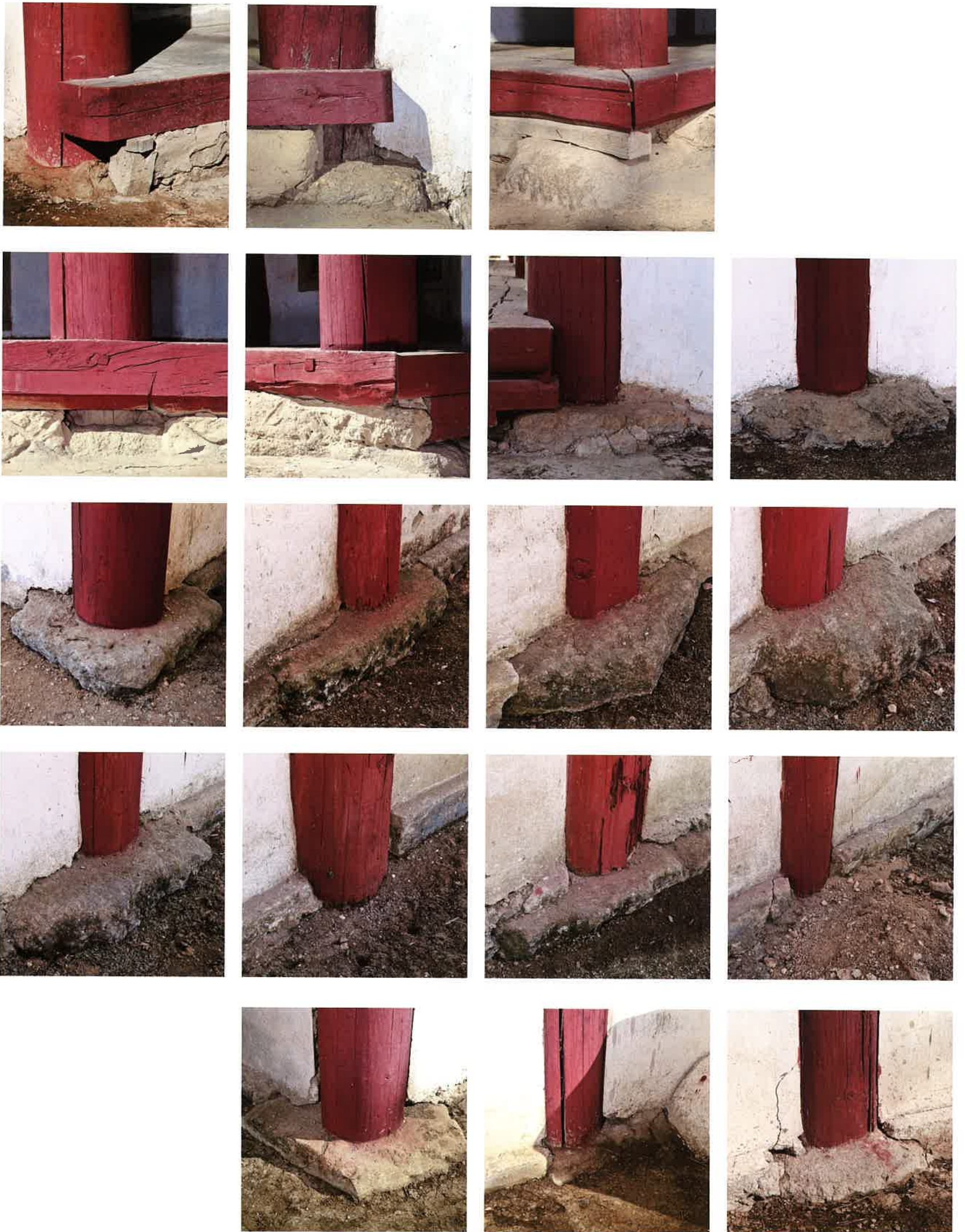
계조암 주춧돌 / 繼祖庵 礎石 / plinths, Kyejoam