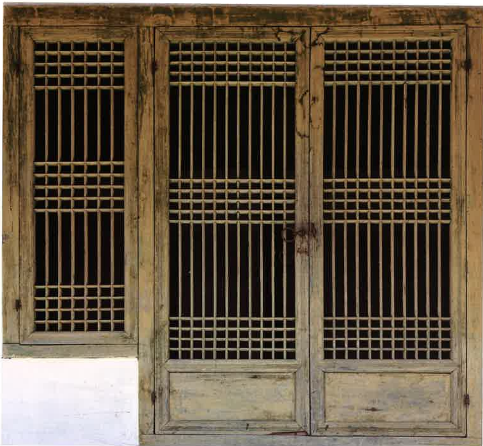
계조암 앞면 왼쪽에서 3번째 창호 / 繼祖庵 前面 左側 3番 窓戶 left window and doors, Kyejoam