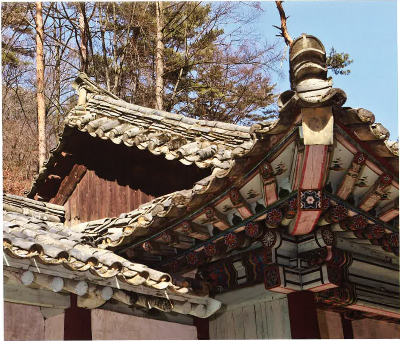
계조암 서쪽 측면 박공과 추녀 / 繼祖庵 西側 朴工·春舌 / gable and protruding corners of caves, western side, Kyejoam