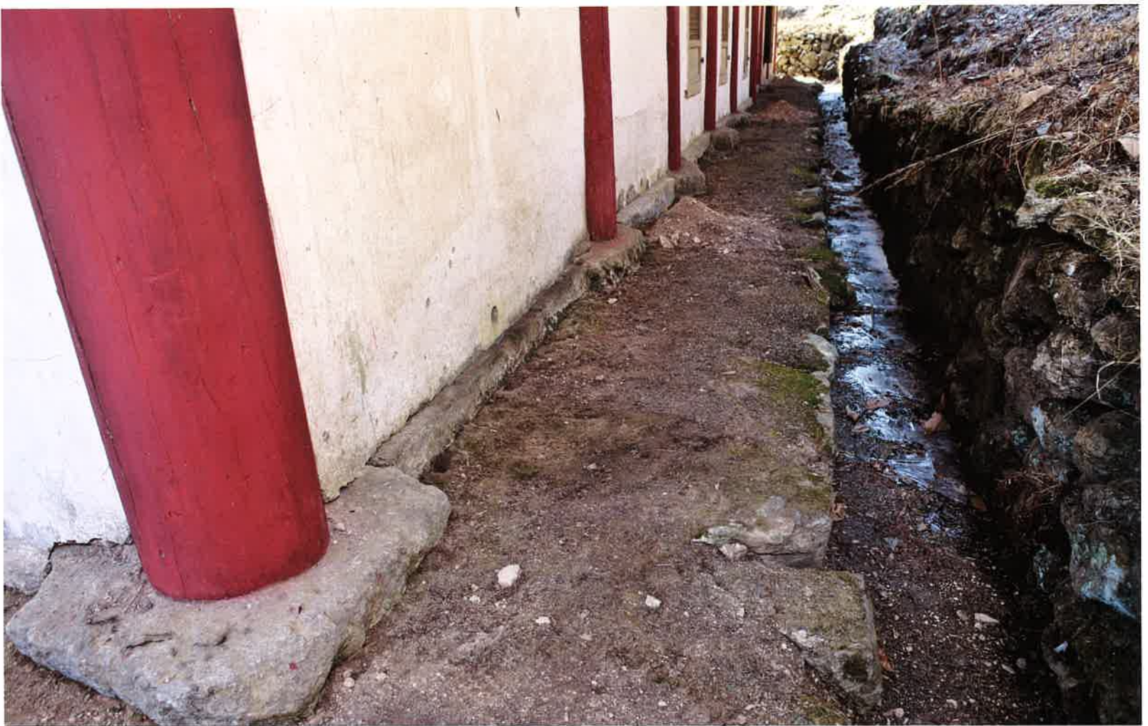
계조암 뒷 기단 / 繼祖庵 後面 基壇 / backward stylobate, Kyejoam