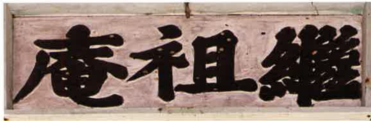
계조암 편액 / 繼祖庵 扁額 / tablet, Kyejoam