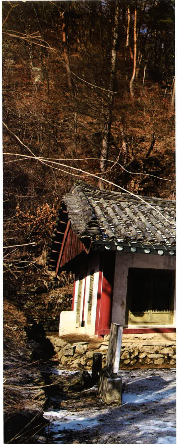
계조암 앞면 / 繼祖庵 前面 front, Kyejoam

평안북도 향산군 향암리에 있다. 보현사 앞 계곡 건너 탁기봉과 탐밀봉 골짜기 사이 '나뭇재'라 불리는 풍치 수려한 곳에 자리잡고 있다. 창건연대는 알 수 없으며 현재의 건물은 1898년에 지은 것이다.