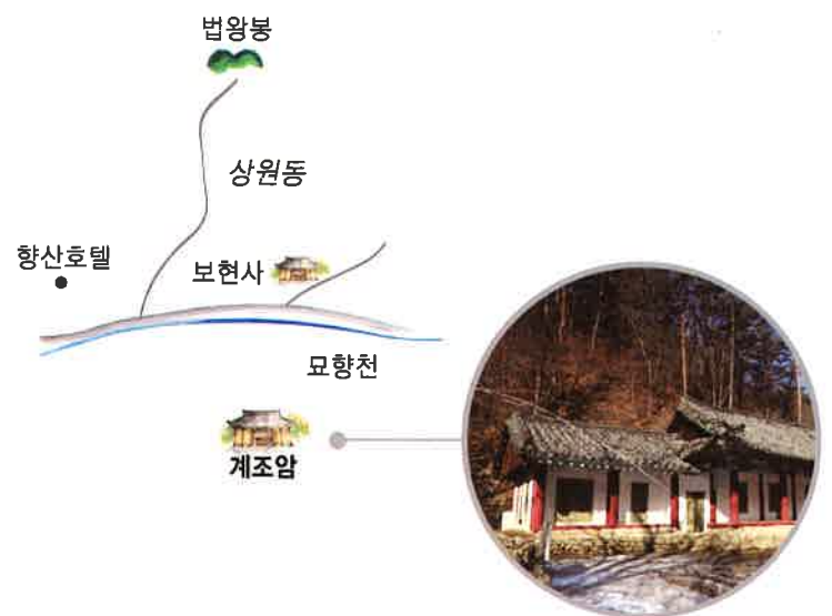
계조암 전경 / 繼祖庵 全景 / whole view, Kyejoam