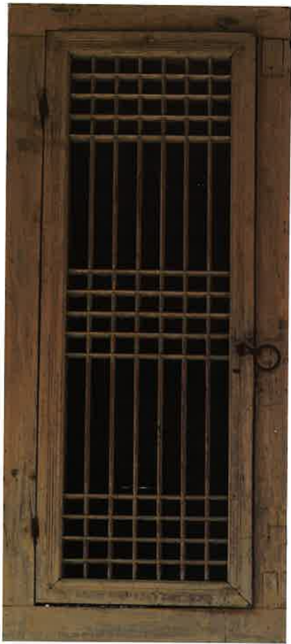
계조암 앞면 왼쪽에서 1번째 창호 / 繼祖庵 前面 左側 1番 窓戶 left door, Kyejoam