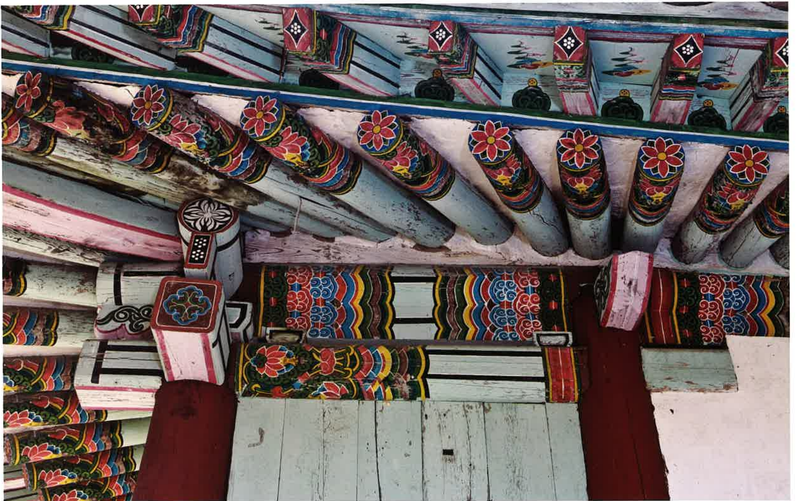
계조암 동쪽 측면 액방과 도리, 장혀 / 繼祖庵 東側 額枋·道里·長舌 / lintel and girder, strip of wood supporting a beam, eastern side, Kyejoam