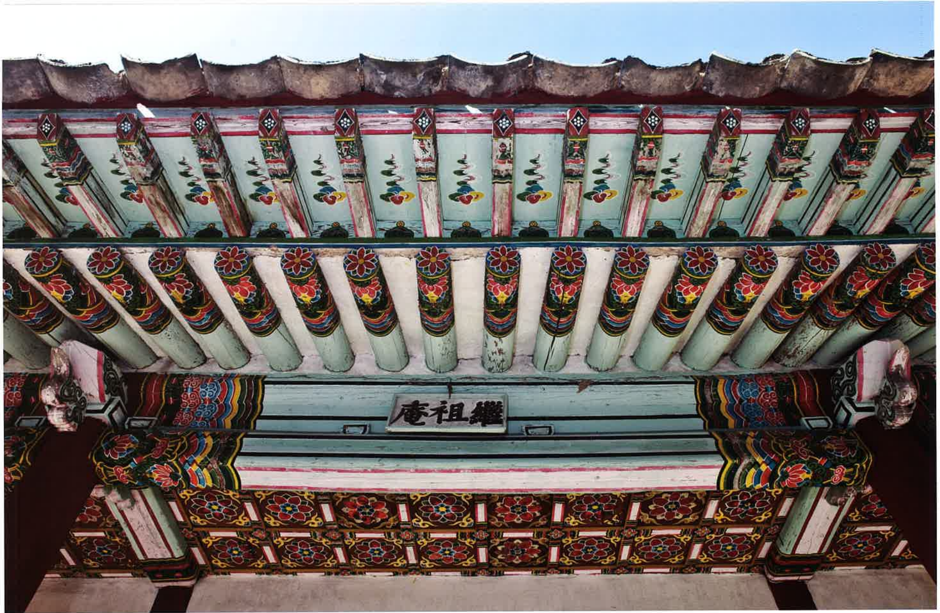
계조암 액방과 부연 / 繼祖庵 額枋·附椽 / lintel and flying rafter, Kyejoam