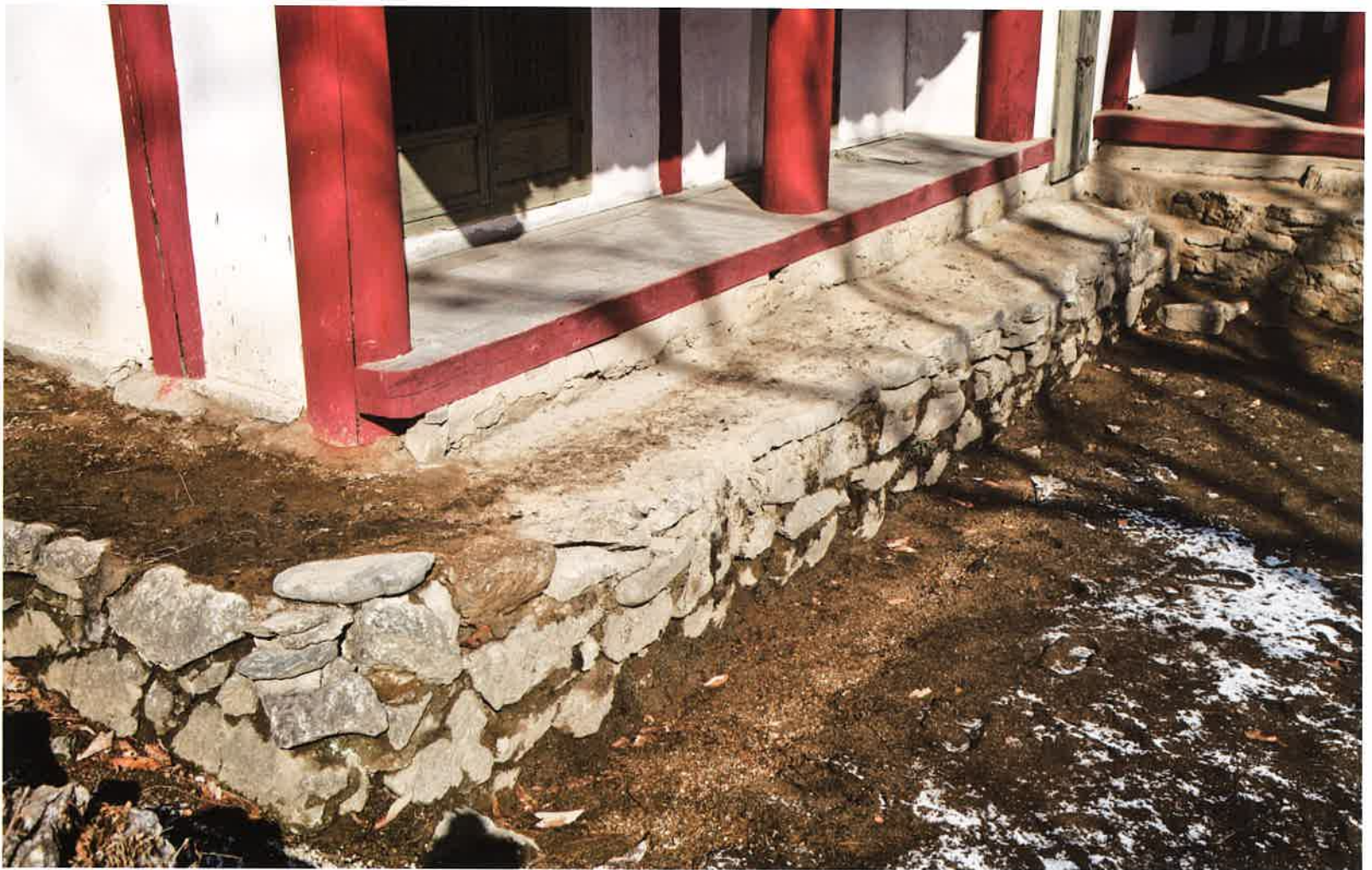
계조암 날개채 앞면 기단 / 繼祖庵 翼舍 前面 基壇 / front stylobate western wing building, Kyejoam