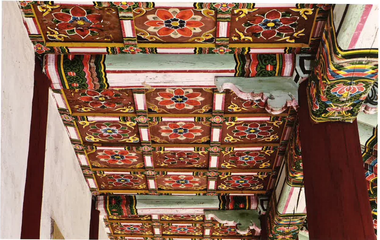
계조암 뒷간 반자 / 繼祖庵 退間 天障 / ceiling of space with extra poles outside the inner fence, Kyejoam