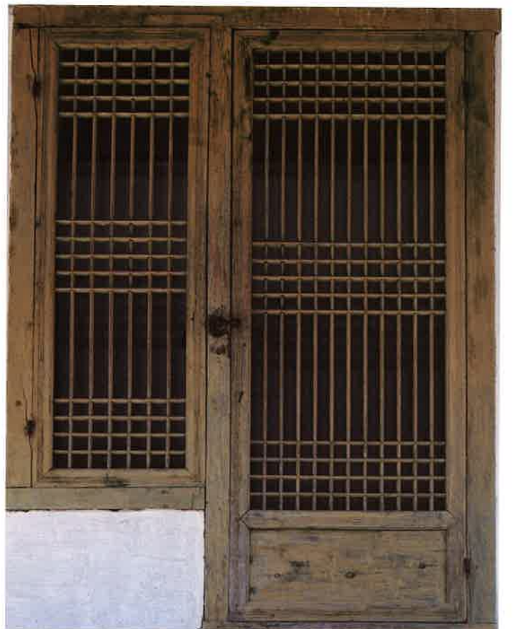
계조암 앞면 왼쪽에서 4번째 창호 / 繼祖庵 前面 左側 4番 窓戶 left window and door, Kyejoam