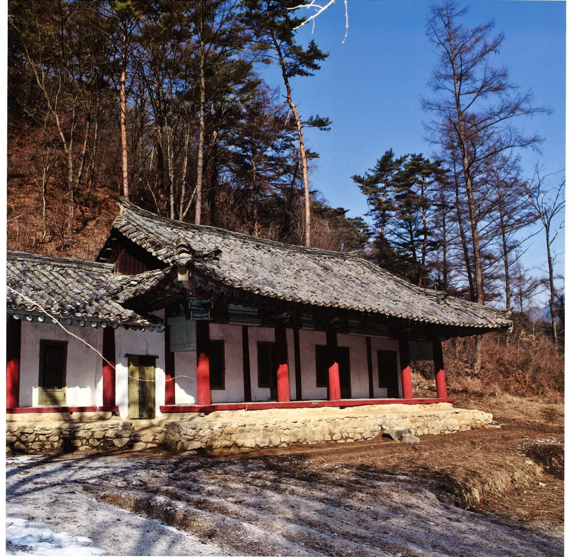
This is located in Hyangam-ri, Hyangsan-gun, Pyŏnganpuk-do. It is placed beautiful spot called 'Namutchaeh' between T'akkibong and T'ammilbong vally in front of Pohyŏnsa. The founded year is unknown but current building was built in 1898.