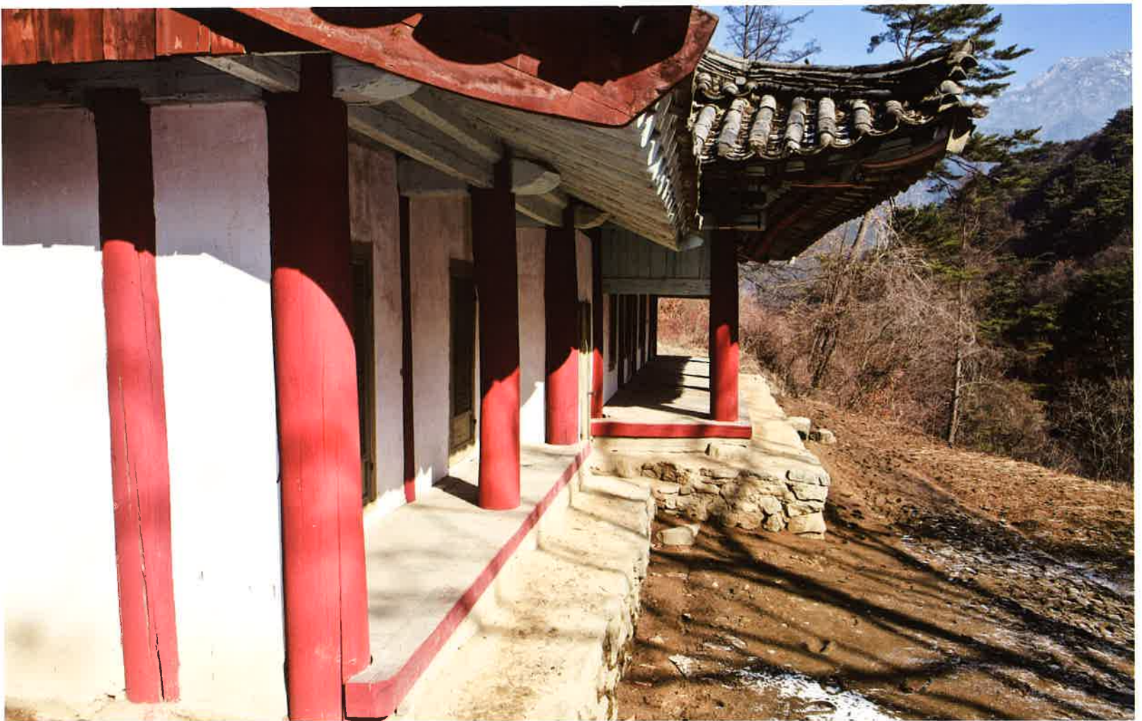
계조암 서쪽 날개채 뒷마루 / 繼祖庵 西側 翼舍 退扶樓 narrow wooden porch running along the outside of a room of western wing building, Kyejoam