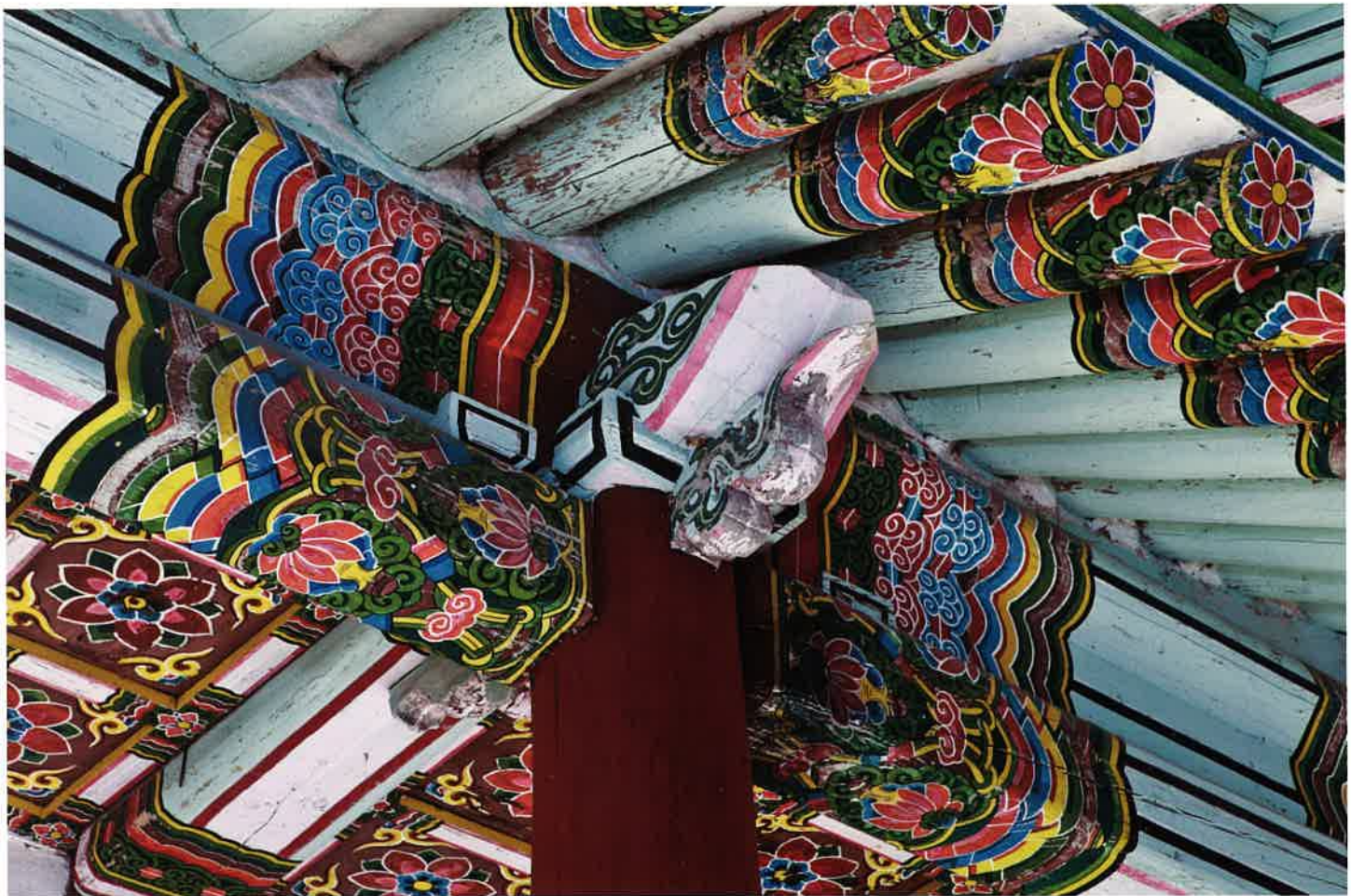
계조암 앞면 주상포 / 繼祖庵 前面 柱上包 / brackets above front columns, Kyejoam