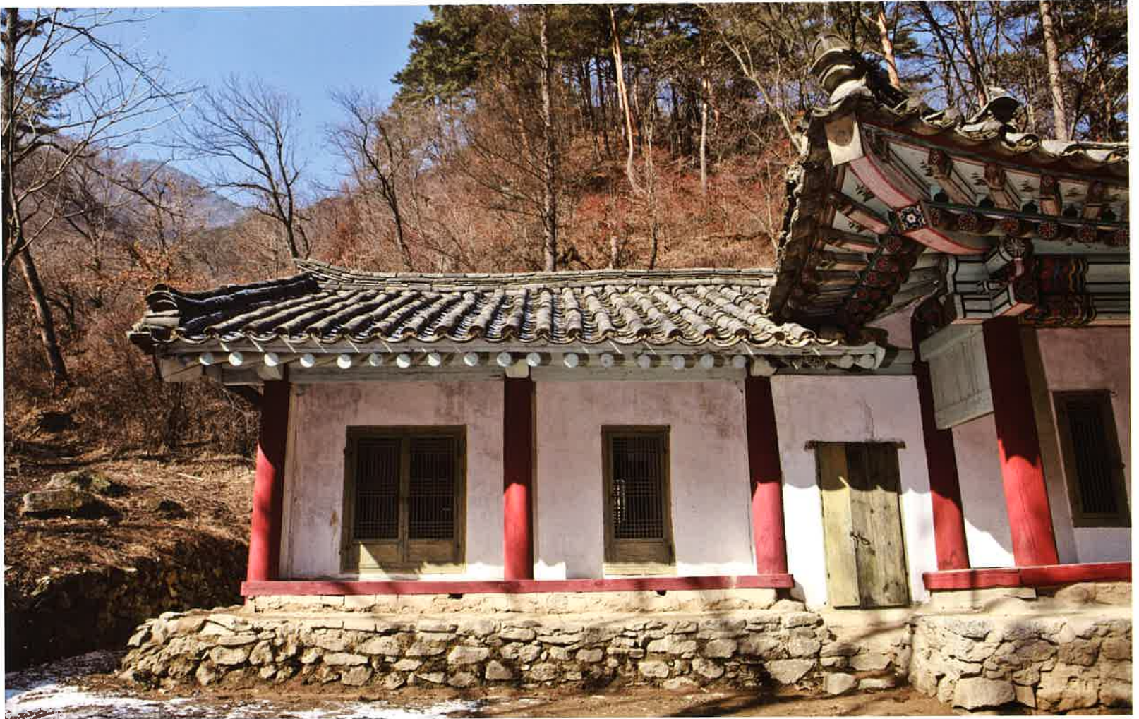
계조암 서쪽 날개채 / 繼祖庵 西側 翼舍 / western wing building, Kyejoam