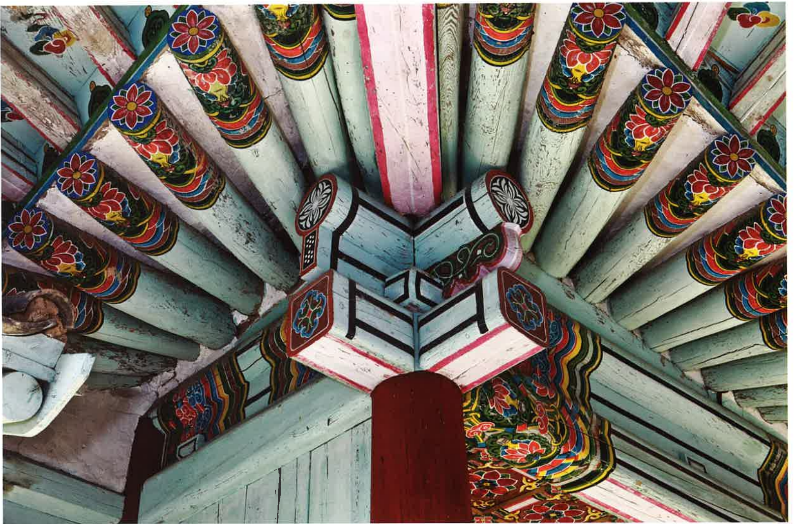
계조암 귀포 / 繼祖庵 耳包 / corner brackets, Kyejoam