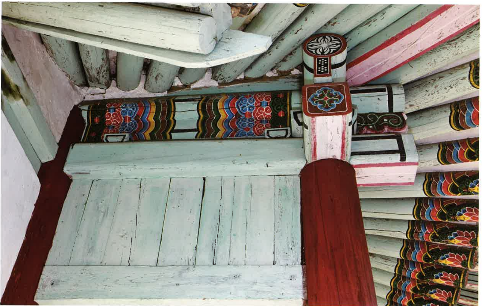
계조암 뒷간 기둥과 액방 / 繼祖庵 退間 平柱·額枋 / columns and lintel of space with extra poles outside the inner fence, Kyejoam