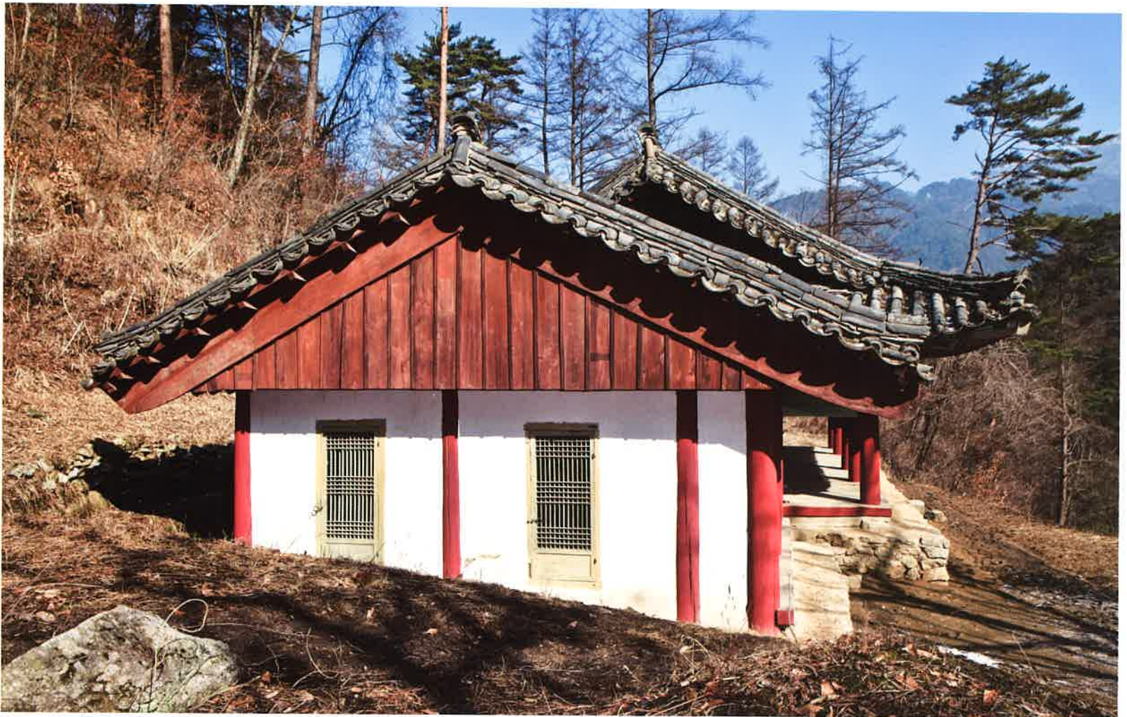
계조암 날개채 서쪽 측면 / 繼祖庵 翼舍 西側面 / western side of western wing building, Kyejoam