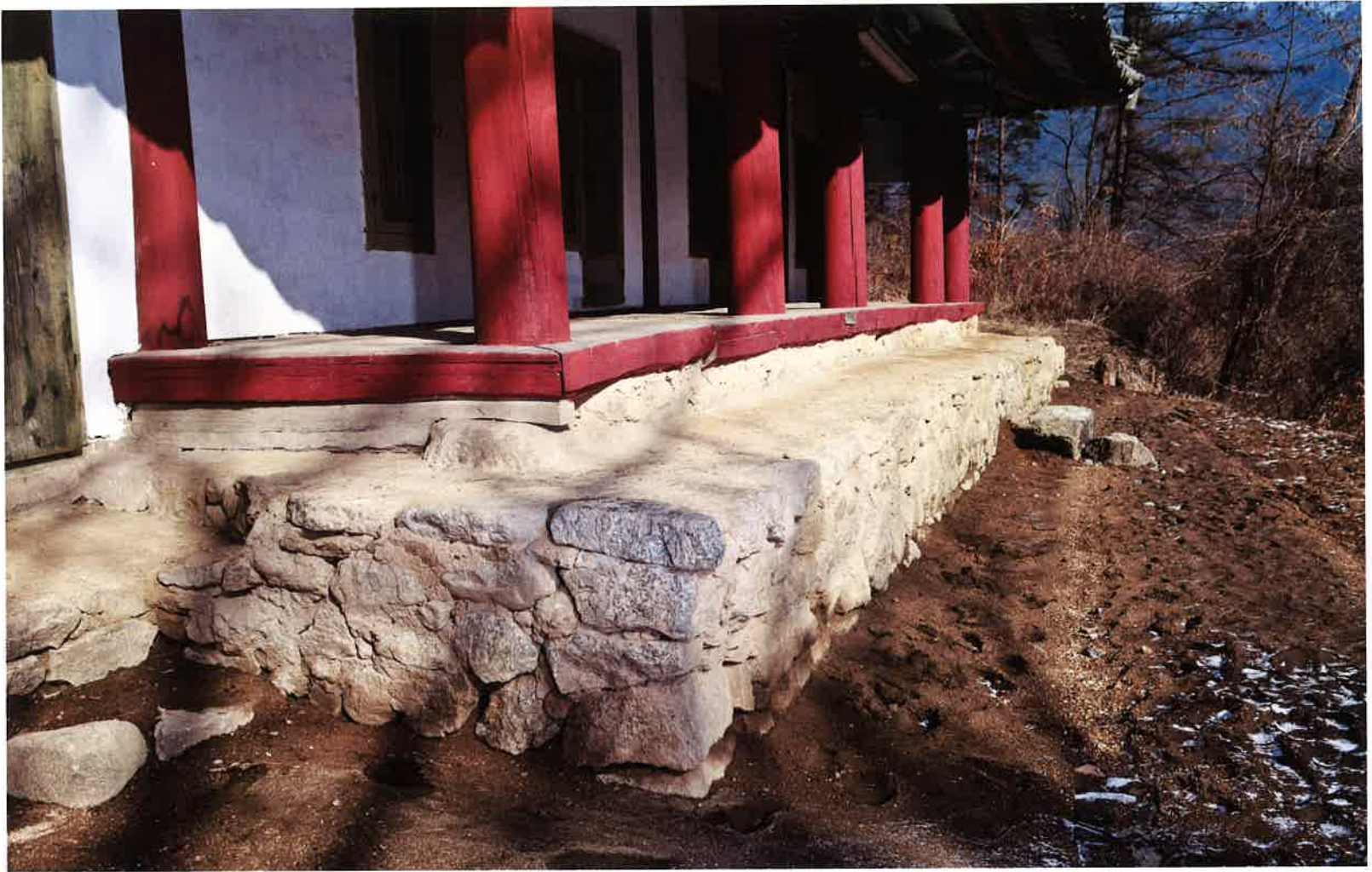
계조암 앞 기단 / 繼祖庵 前面 基壇 / front stylobate, Kyejoam