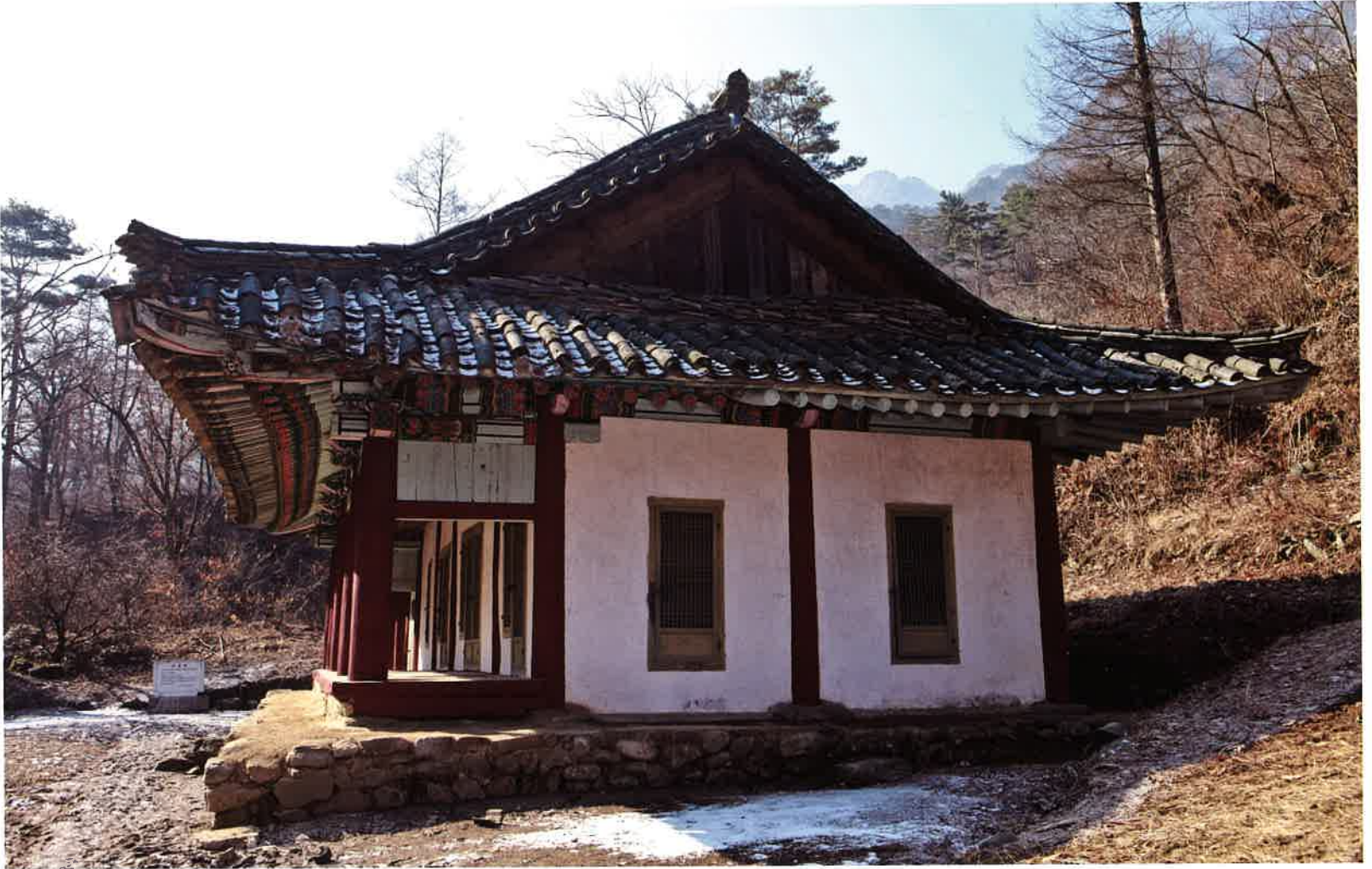
계조암 동쪽 측면 / 繼祖庵 東側面 / eastern side, Kyejoam