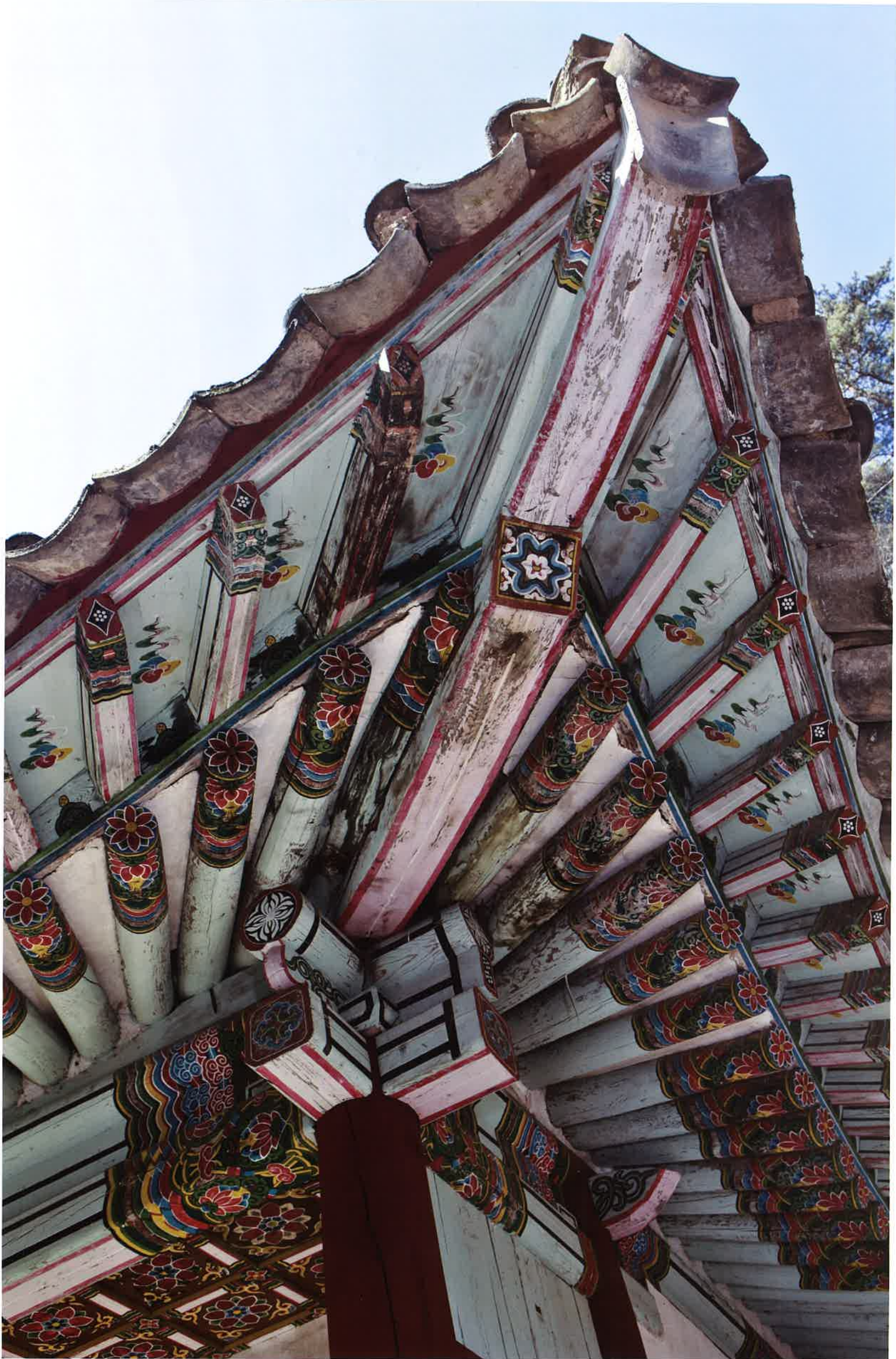
◀ 계조암 처마와 공포 / 繼祖庵 軒·拱包 eaves and brackets, Kyejoam